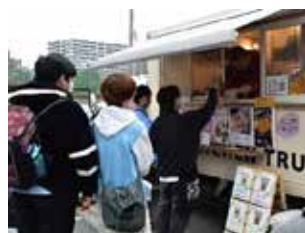
売り切れ御免のたい焼き屋さん