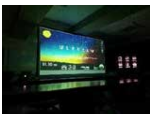
街なかプラネタリウム“ほしぞらさんぽ”