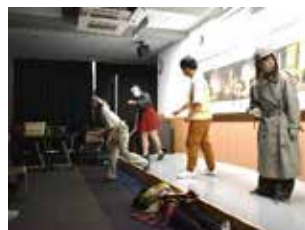
演劇部による文化祭記念公演