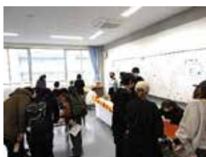
当日は盛況！あちこちで謎を解く姿が