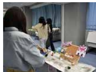
たくさんの「すき」を集めました