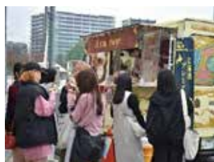
大好評につき今年もおいしい文化祭♪