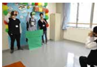
フォトスポットのテーマは秋のマリオワールド