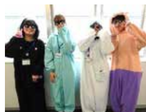
ヒントを持ち歩いたコスプレスタッフたち