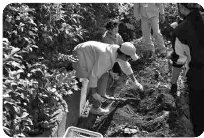
さつまいも収穫(四丁目菜園)