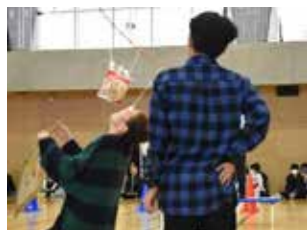
【新企画】ミニ運動会パン食い競争