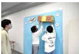
【準備中】壁紙の貼り付けに悩みました…

今年度は、通信教育コース生徒会役員が中心となり、通信教育コース有志生徒とともに『謎解きウォークラリー2023』を企画・運営しました。今年度は、謎解きに加え、ヒントをもらえるチャンスがあったり、ゴール地点にフォトスポットを設置したりと、昨年度より趣向を凝らして実施しました！