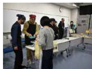
商業科プロジェクトもあっという間に完売！