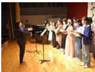
有志による合唱心をひとつに