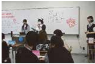
ボカロイントロクイズ大会 猛者が現れたとか…