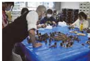
季節先取り♪ クリスマスリース制作