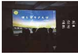
大大好評企画！ ほしぞらさんぼ2024