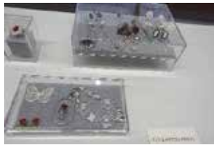
4Chome Art-Bace 今年もすばらしい作品ばかり