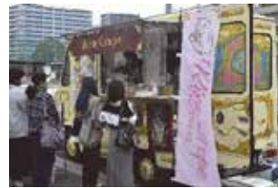
今年もキッチンカーには 長蛇の列