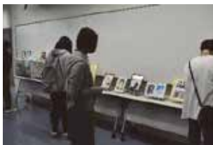
文芸部による 作品展