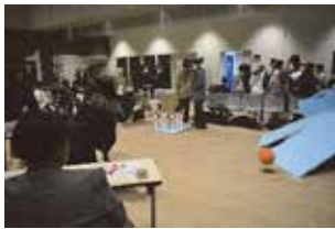
バンクボウリング 何ピン倒せたかな？