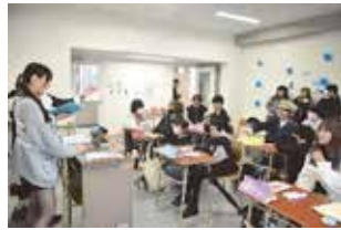
全3回とも大盛況！ 座りきれず、立ち見の人も