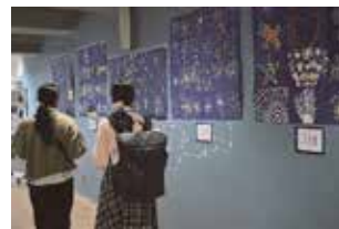
HANABI 彩とりどり 大輪の花をシールアートで