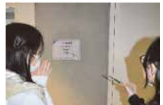
自信のある答えを並べる 謎解きビンゴ