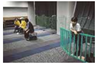
演劇部による 文化祭公演