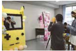
フォトスポットは2か所 どちらも高い完成度！