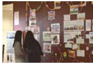
ESSの展示 今年のテーマは「世界の祭り」