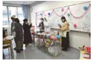
スタンプラリーゴール地点 たくさんの参加、 ありがとうございました！