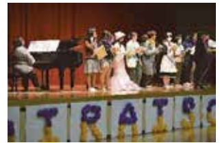
音楽同好会と有志による 「声の花束」