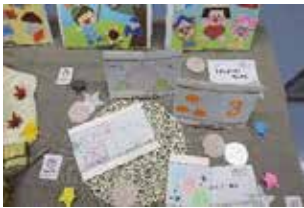
家庭科で制作した 作品の展示