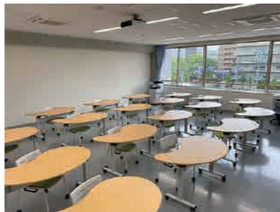
マーケティング実習室