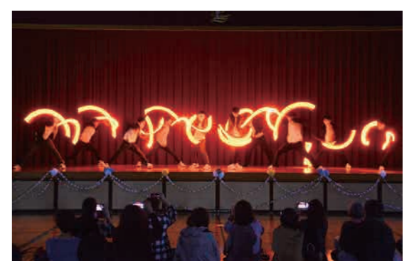
授業・スクーリング