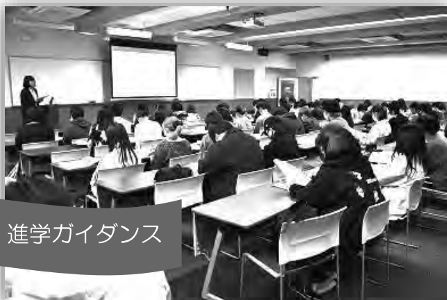
第1回 就職・進学ガイダンス