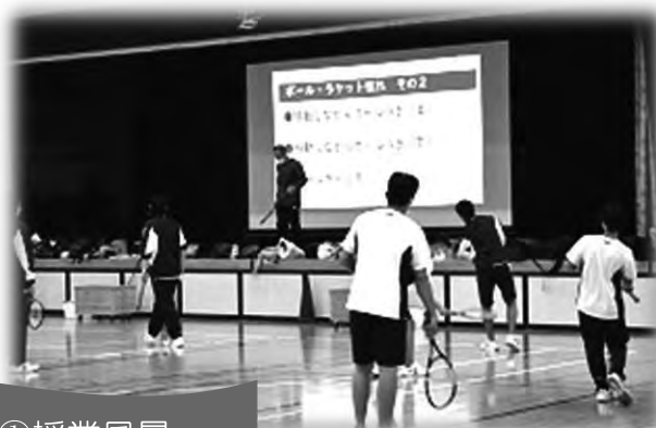
スクーリング①授業風景